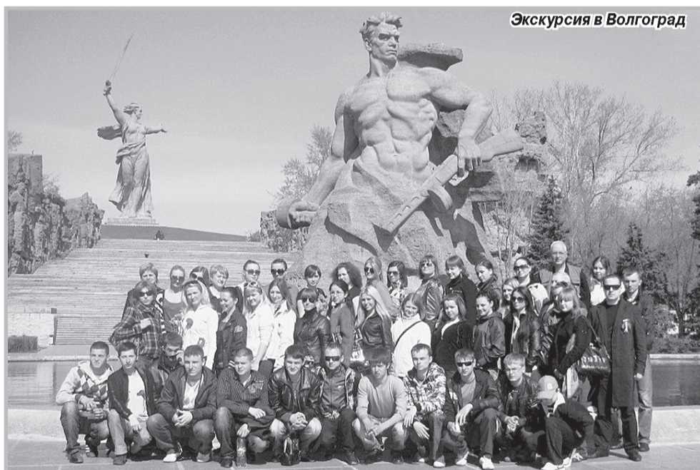
Экскурсия в Волгоград