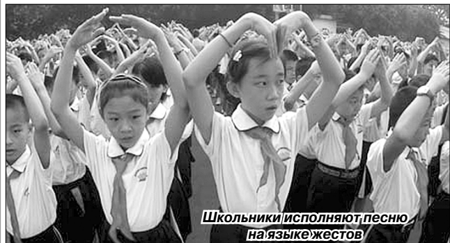
Школьники исполняют песню на языке жестов

В этот день школьники и студенты дарят своим наставникам цветы и подарки, сделанные своими руками. Кроме того, школьники исполняют песни на языке жестов и пишут поздравления на доске, чтобы выразить таким образом глубокую благодарность своим учителям.