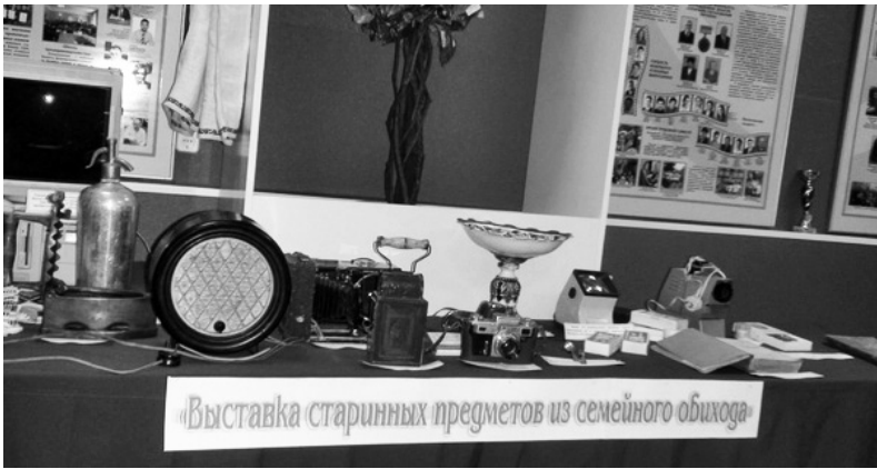
Выставка старинных предметов из семейного обихода

У нас давно стало доброй традицией — помимо стационарной экспозиции в музее истории НУА, которая обновляется систематически, но медленно и точно, знакомить наших «академиков» и гостей академии с важнейшими текущими событиями, рассказывая