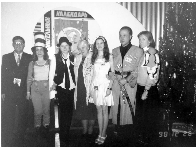
Новый год в НУА (1998 г.)

НУА дает первоклассное образование, помогает сформировать широкий кругозор. С уверенностью могу это сказать, имея