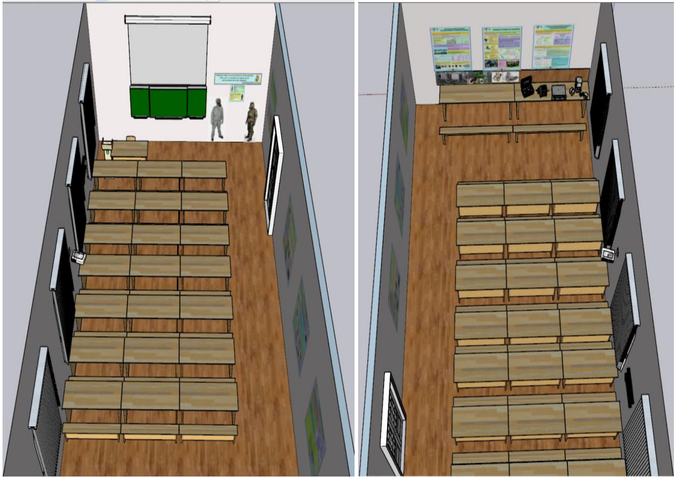
Фронтальний вид навчального класу