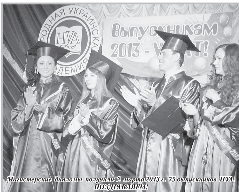
Магистерские дипломы получили 2 марта 2013 г. 75 выпускников НУА. ПОЗДРАВЛЯЕМ!

ГАЗЕТА ХАРЬКОВСКОГО ГУМАНИТАРНОГО УНИВЕРСИТЕТА «НАРОДНАЯ УКРАИНСКАЯ АКАДЕМИЯ»